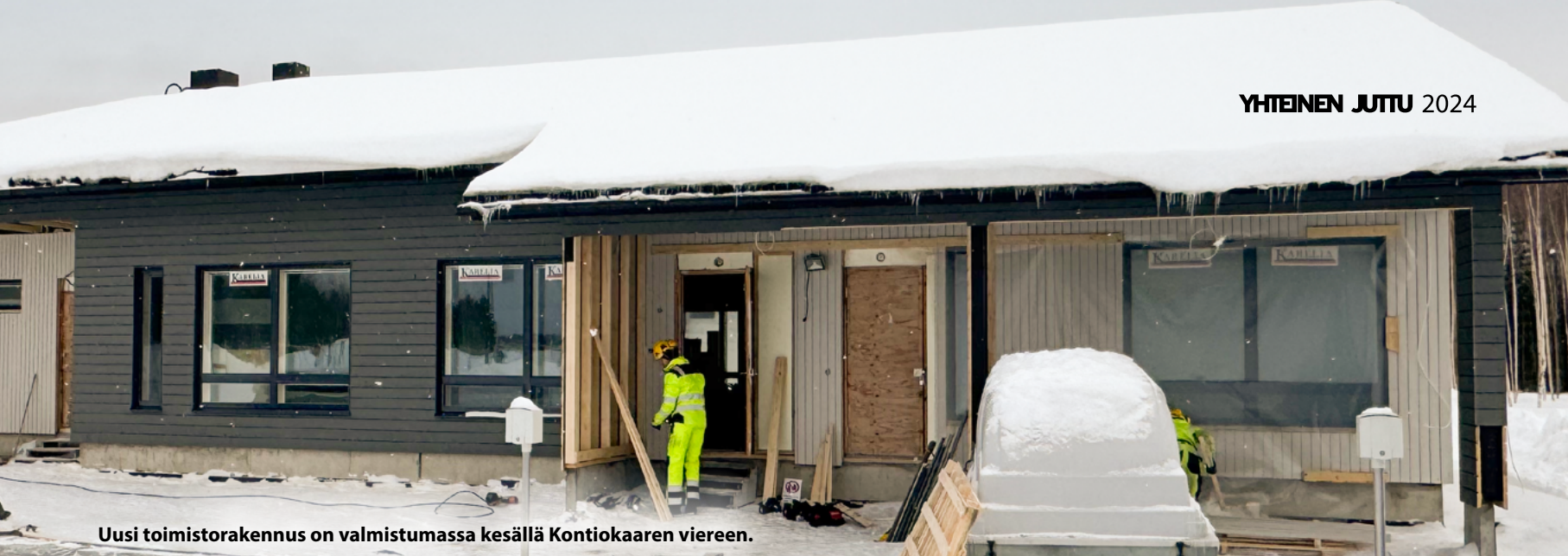
Uusi toimistorakennus on valmistumassa kesällä Kontiokaaren viereen.